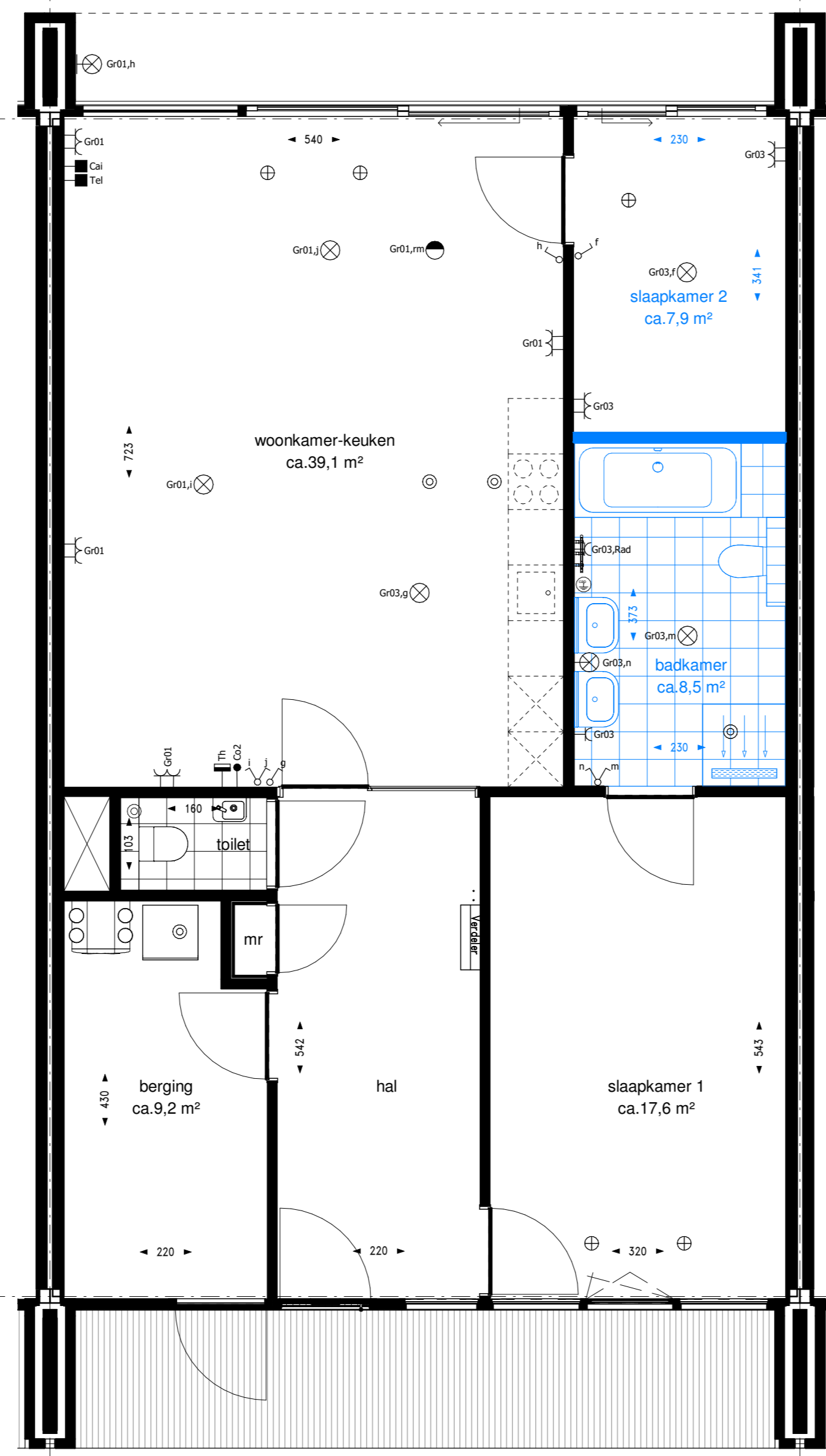
optie B023: bad