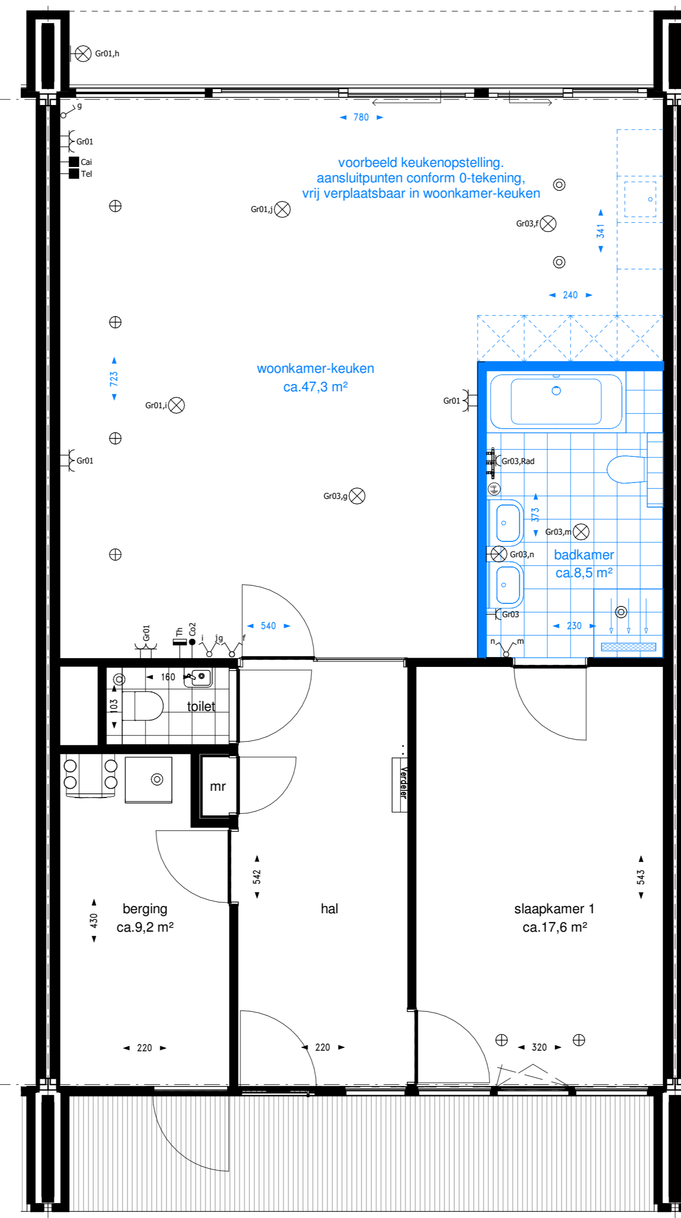
optie B020 + B023: bad en vervallen slaapkamer 2 i.c.m. verplaatsen positie keuken